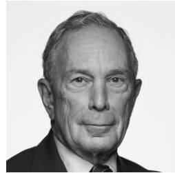
MICHAEL R. BLOOMBERG