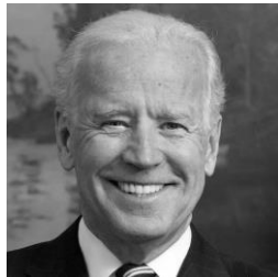
JOSEPH R. BIDEN